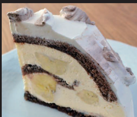
バナナスショコラ