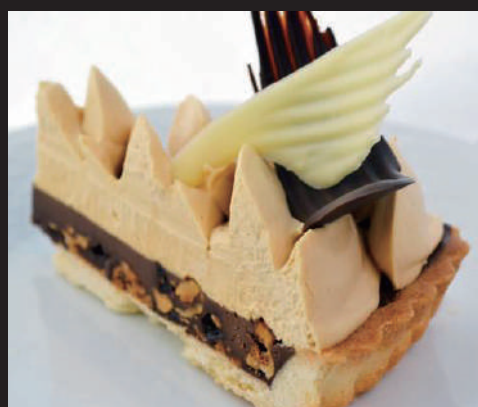
チョコとキャラメルのタルト