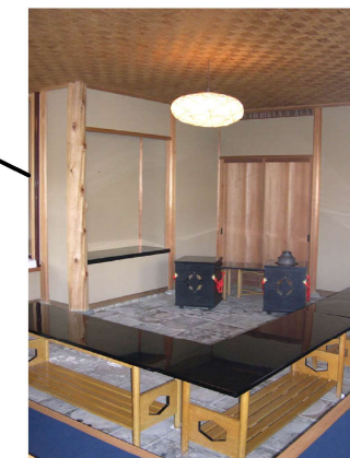
立礼席 約25㎡ (約12~13名様収容) 〈椅子席にてお茶を楽しめます〉

隣接した立礼と広間は、 収納可能な二枚襖によって くぎられ、それぞれ 独立した茶室としても 使用出来ます