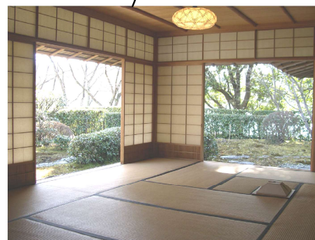
広間 10畳 (約13~15名様収容)

隣接した立礼と広間は、 収納可能な二枚襖によって くぎられ、それぞれ 独立した茶室としても 使用出来ます