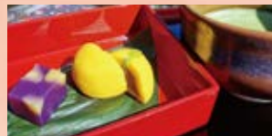
和菓子セット 抹茶付き ・紅芋羊かん ・上生菓子(柚子)