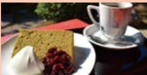
抹茶シフォンケーキと コーヒーセット