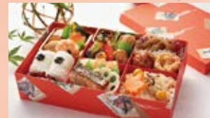
秋日和 彩り弁当 (お茶付き) 1,500円