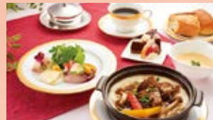
京風白みそ ビーフシチューランチ 1,500円