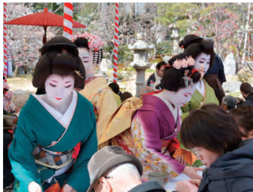
梅花祭野点大茶湯(毎年2月25日)