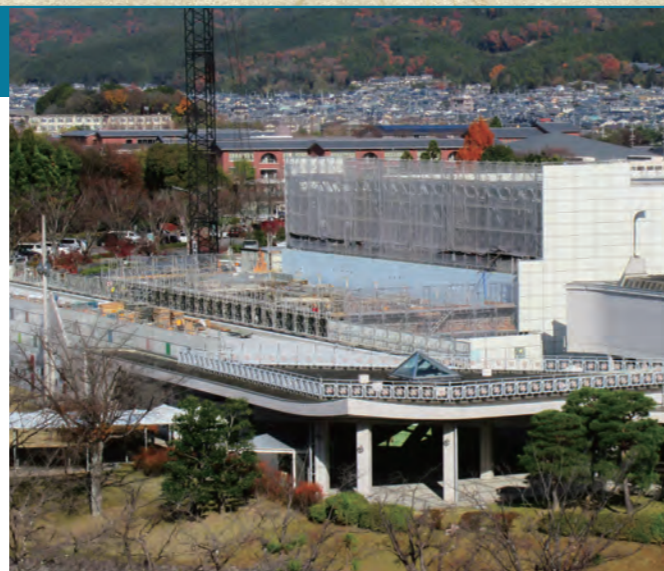
▲現在の本館側からみたニューホール

※今後も、このコーナーでは、ニューホール建設工事の様子をお知らせしていく予定です。