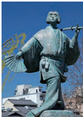
出雲の阿国像(四条大橋東詰)