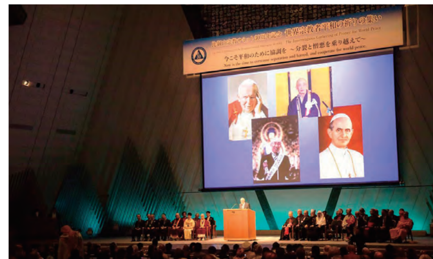
比叡山宗教サミット30周年記念世界宗教者平和の祈りの集い(2017年8月3-4日)国立京都国際会館メインホールにて

1942年東京生まれ。慶応義塾大学法学部法学科卒業。大正大学大学院博士課程単位取得。その後、東京大学助教授、比叡山宗教サミット事務局長、天台宗機願問会会長、天台宗機願問会副会長、大正大学理事兼学長などを歴任。現在、天台宗機願問会会長、世界宗教者平和会議(WCRP)日本委員会理事長。2017年6月には三十三間堂本坊妙法院門跡門主第五十二世継任。著書「はじめての法華経」(春秋社)など多数。