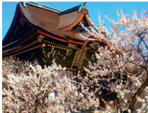
三光門【重要文化財】