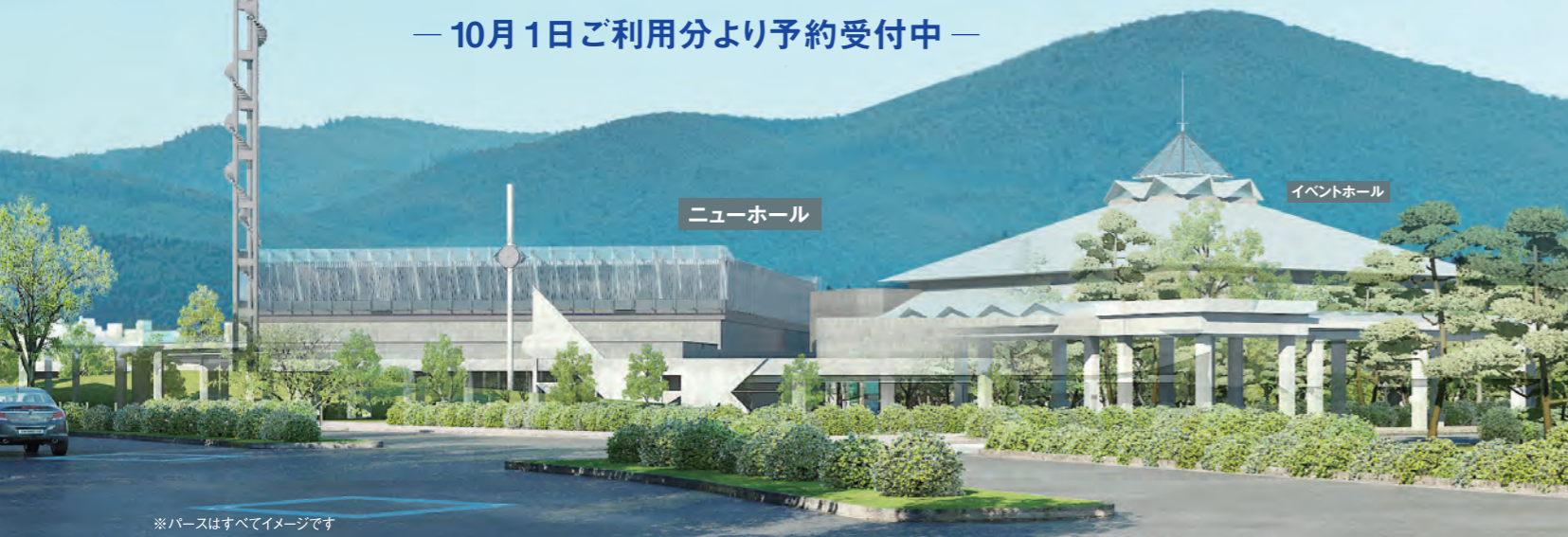
※パースはすべてイメージです