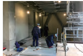
受変電設備設置箇所(電気室)▶

建物内の各機械室なども完成し、建物に必要不可欠である電気設備や空調機器を順次、搬入設置しております。