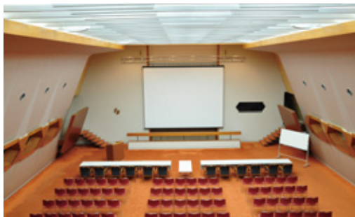
会議場 Room B-1, Room B-2 の耐震工事並びに内装工事が完了しました。