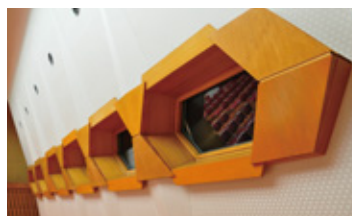
会場内の照明を LED 灯具に変更したことで省エネ化と共に明るくなり、 織物を用いた壁紙も新しく張り替えをしました。

平成25年7月6日～10月20日までの期間、会議場 Room Aの耐震改修工事及び 内装改修工事が実施されます。工事期間中は大変ご迷惑をおかけいたしますが、 何卒ご理解ご協力をお願い申し上げます。