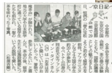
※2013年4月30日(火)京都新聞朝刊 掲載記事

4月29日(祝・月)に開催された宝松庵茶会には、アフガニスタンをはじめとする4カ国からの留学生約20名を招待しました。昭和59年の開始以来、留学生を招待するのは初の試みとなり、お茶の体験とともに京都国際会館の魅力やPRするよい機会となりました。今回は約600名のお客様にご参加いただき、豊かな自然とお茶の世界を楽しんでいただきました。